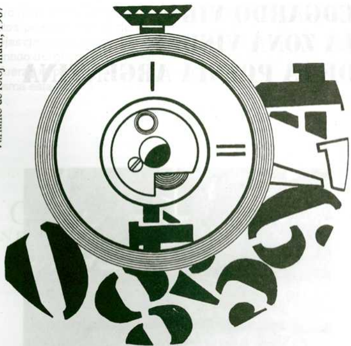
Variante de reloj inútil, 1967

teoría o el parco imaginario de alguna tendencia. Todo discurso de sustentación, todo intento por perfilar este drama de las formas, toda insistencia en la detección, a diestra y siniestra, de sus "síntomas" o su "carácter", no haría más que revelar un empobrecimiento brusco ante aquello cuya iluminación consiste, precisamente, en la ausencia de un sustrato de razones, en la dichosa indefensión de una epistemología propia.