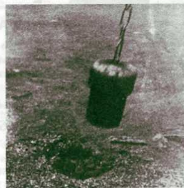
El tapón del Río de la Plata Bocacerrada - Punta Lara - Río de la Plata, 1973